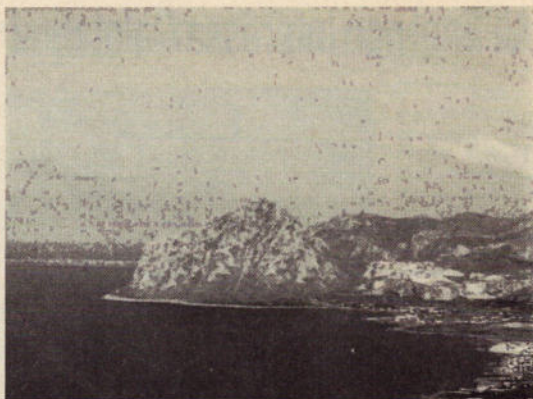
Monte Cofano visto da Erice

Monte Cofano è stato inserito fra le 16 nuove riserve naturali della Sicilia. Ciò influirà positivamente sull'economia di Custonaci, che, oltre al marmo vanterà adesso anche un patrimonio naturale da fare vedere e da proteggere. L'elenco delle 16 riserve è stato pubblicato sulla Gazzetta ufficiale della Regione. Le aree interessate saranno affidate alla gestione della «Forestale» che garantirà la continuazione delle attività tradizionali e le coltivazioni biologiche, nonché la tutela assoluta del patrimonio faunistico e, quindi, la salvaguardia dell'ecosistema.