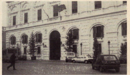
Trapani palazzo di città